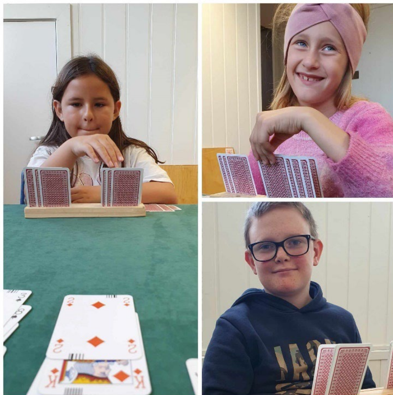
Nye rekrutter var med på bridge i høstferien.

I tillegg til den faste spillingen på torsdager/mandager har vi invitert barn/ungdom fra nærliggende klubber ved et par anledninger: Påskespesial (lagkamp, kanelboller og Solo) 6. april, og bridge i høstferien (kanelboller, saft, lagkamp og begynneropplæring).