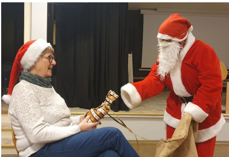
En liten nissepakke til snille hjelpere.