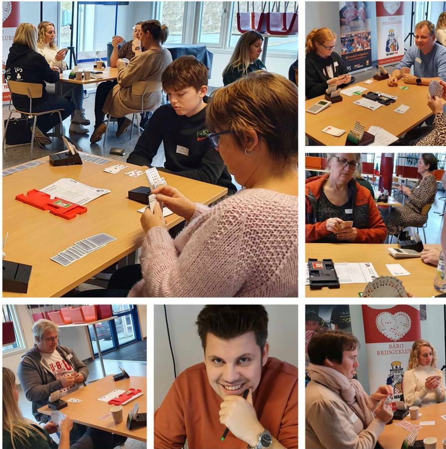
Øyeblikk fra BB Kløver 2022.