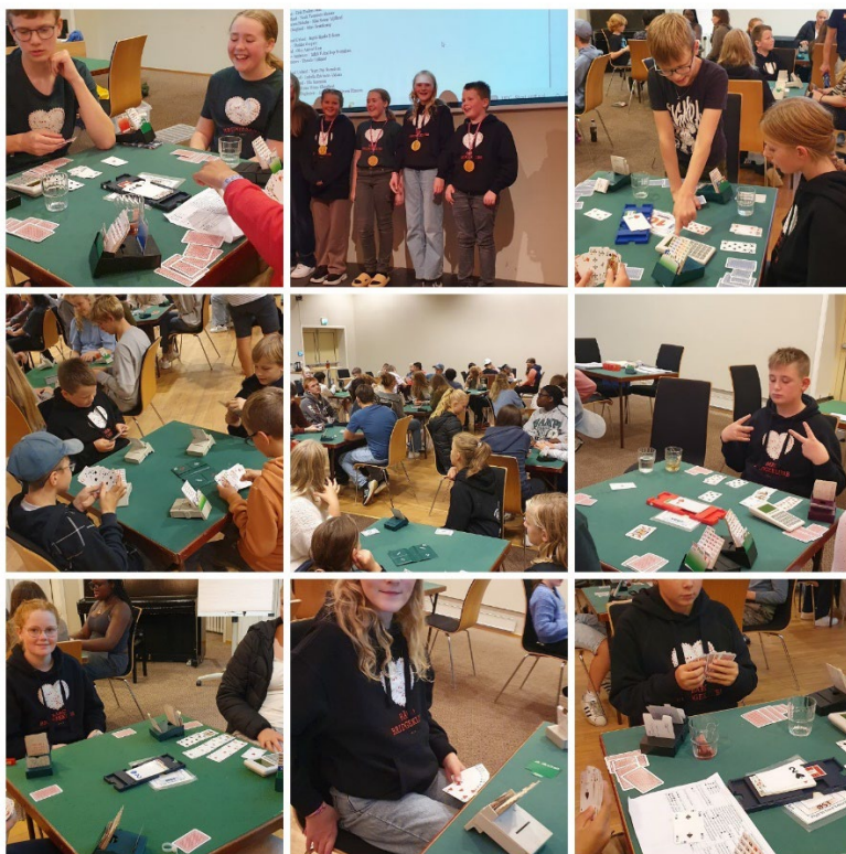
Glimt fra bridgen under treningshelga. Alle bildene kan sees her: https://photos.app.goo.gl/TZ1dyRAJaBWN4hYW9